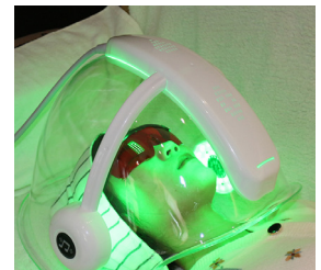
EQUILIBRA LA PIEL