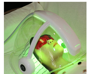
AUMENTA LA INMUNIDAD