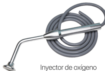
Inyector de oxígeno