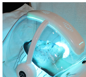
REALFIRMA Y TENSA LA PIEL