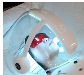
PROMUEVE EL METABOLISMO

OXYDOME FOTOBIMODULACIÓN LED CON OXÍGENO PURO