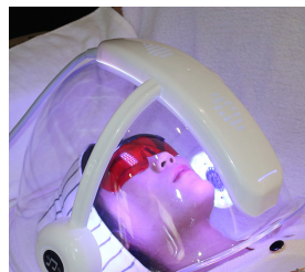
MARCAS DE ACNÉ